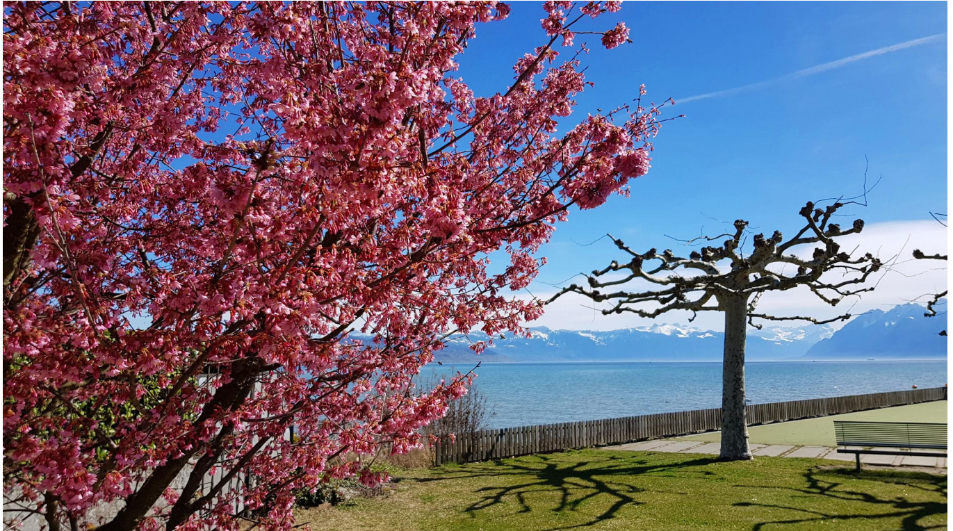
Spring on teh Jakobsweg at Saint-Sulpice